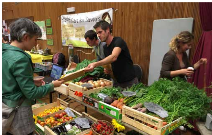
Conférence sur l'autonomie alimentaire en Belgique au centre culturel de Chimay le 3 octobre 2017 en présence de producteurs locaux et d'associations de transition citoyenne.

de noix, de diverses céréales, d'œufs et de viandes, si nous sommes loin de la mer, de poissons d'élevages en eau douce, ainsi que des produits laitiers et des huiles végétales ; le tout étant récolté, voire transformé sur ce territoire situé dans une périphérie à moins d'heure