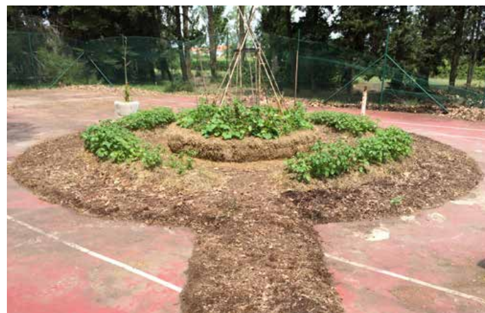
Création du potager pédagogique à vocation thérapeutique sur un ancien terrain de tennis à Montcalm sur la commune de Vauvert dans le Gard.

FR – Oui justement ! Cette invitation au voyage est une proposition à prendre notre destin en main, à être le changement que nous voulons voir dans ce monde sans attendre que la réponse vienne d'en haut, ou de je ne sais où ! Nous sommes